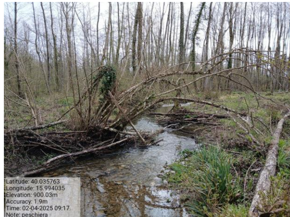
Int. 6.1.3 Fosso Torrente Peschiera Foto 1