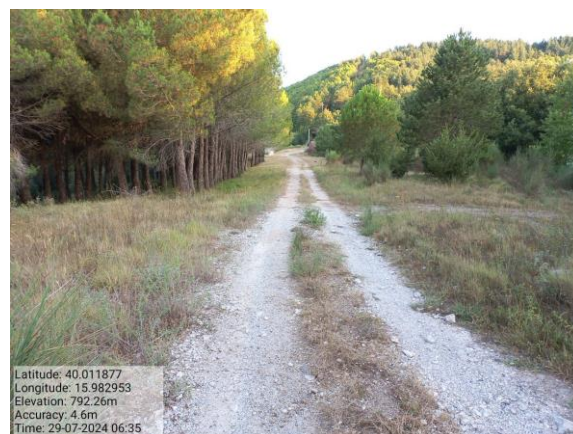
Int. 1.1.2 Viale tagliafuoco Bosco Difesa F. 54 P. 178