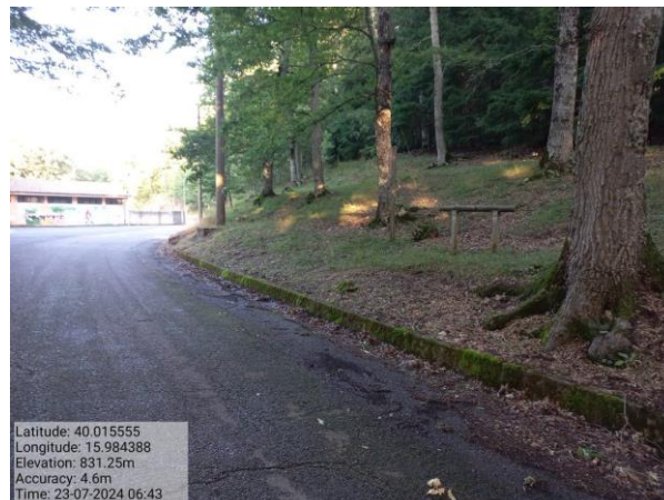
Int. 1.1.1 Viale tagliafuoco Bosco Difesa F. 53 P. 129-130