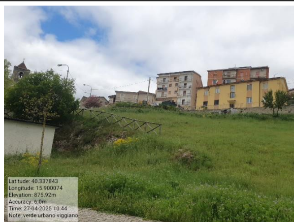
Missione 2.1.1 manutenzione verde urbano - Foto6