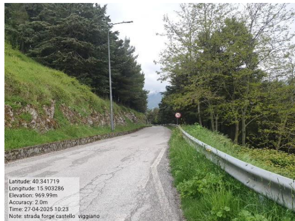
Missione 5.2.1. diradamento e ripuliture - Foto1