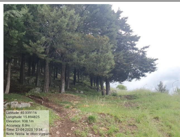
Missione 6.1.1 manutenzione reticolo idrografico - Foto3