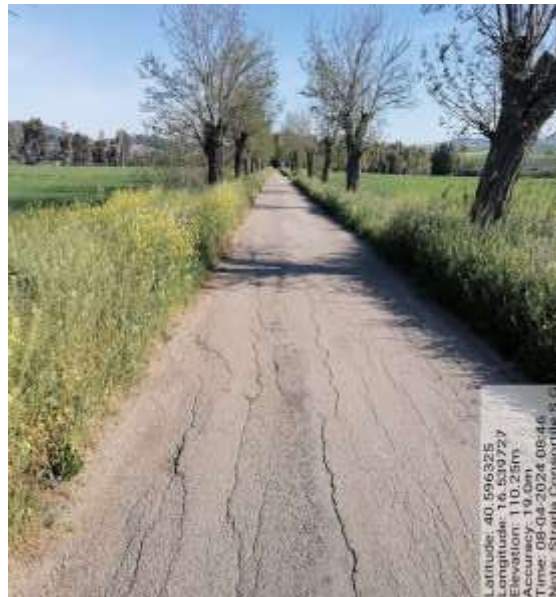
Int. 6.3.1.1 S. Consortile Diga S. Giuliano 1 Tratto- Foto25