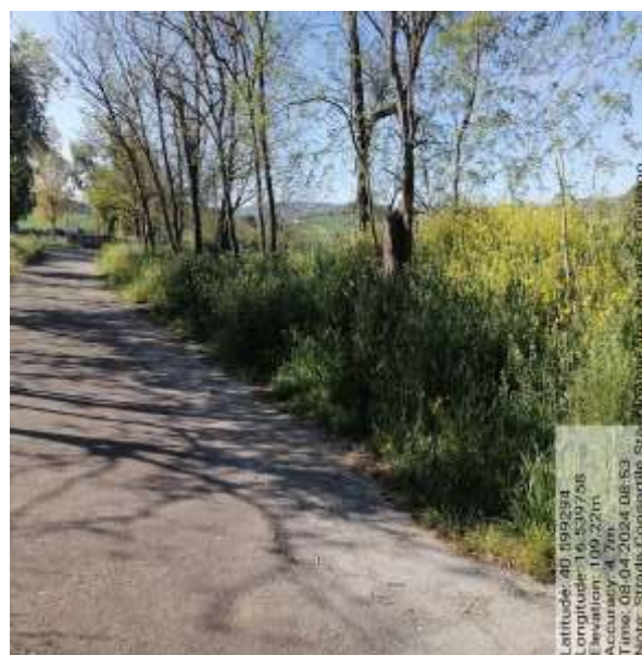
Int. 4.6.1- Staccionata strada di accesso area Pic nic S.Giuliano - Foto13