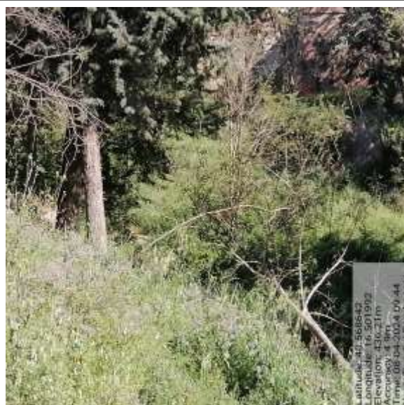
Int. 5.1.2 Pendici del Parcheggio fg 22 plla 1056 Foto 18