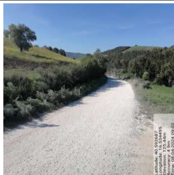
Int.6.3.5.1 S. C. Piano Tre Carri San Giuliano Foto 35