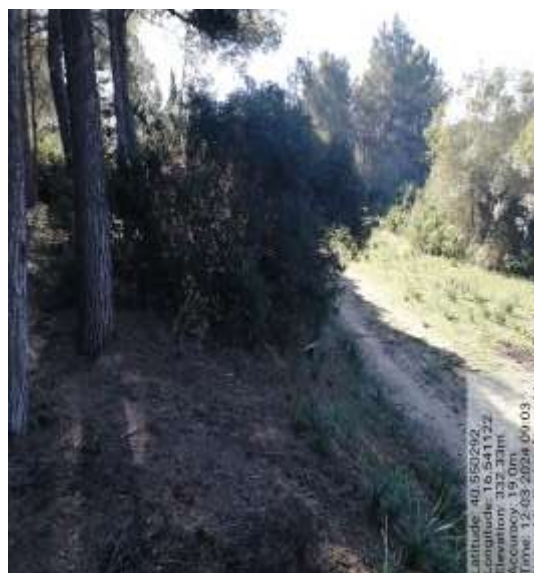
Int. 1.1.2 Fasce Taglia Fuoco fg 35 Plla 114 - Foto3