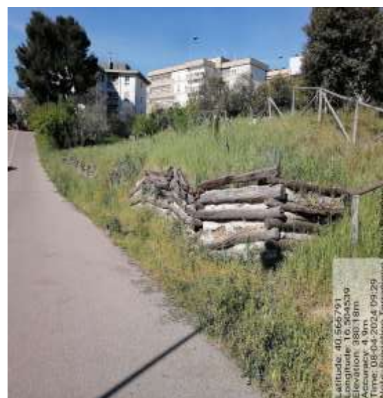
Int.6.2.1 Ripristino terrapieno Parco Ragone fg 32 plle 701-702 – Foto 23