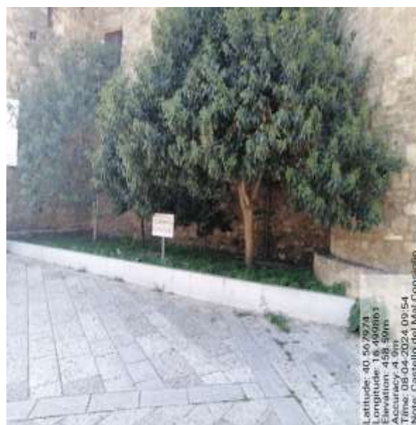
Int. 2.1.1 Aiule Castello del Malconsiglio - Foto5