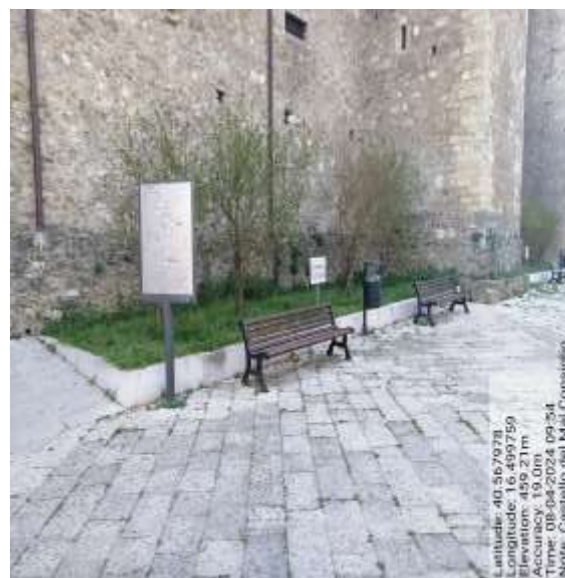
Int. Int. 2.1.1 Aiule Castello del Malconsiglio - Foto 7