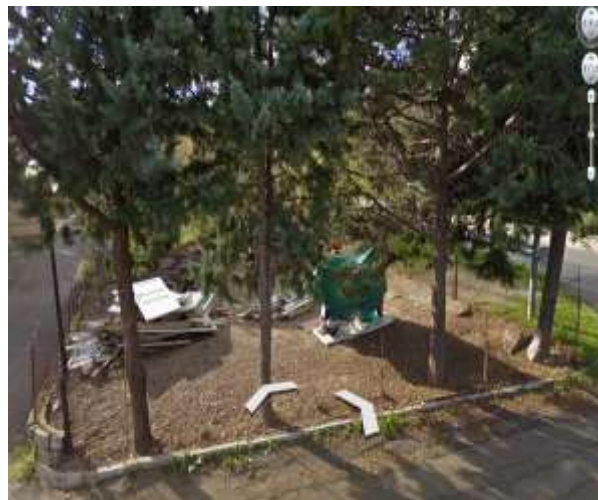
Int. 4.6.3 – Realizzazione Staccionata – Rione Michele Bianco Int. 4.6.3. Staccionata