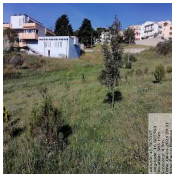
Int.3.2.3 Collocamento a dimora Piantine forestali - Foto 11