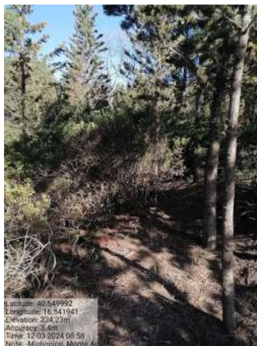
Int. 4.6.2- Ripristino Staccionata parco Ragone - Foto 15