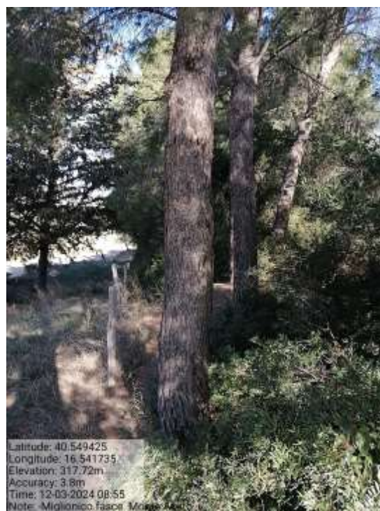
Int. 1.1.2 Fasce Taglia Fuoco fg 35 Plla 114 - Foto1