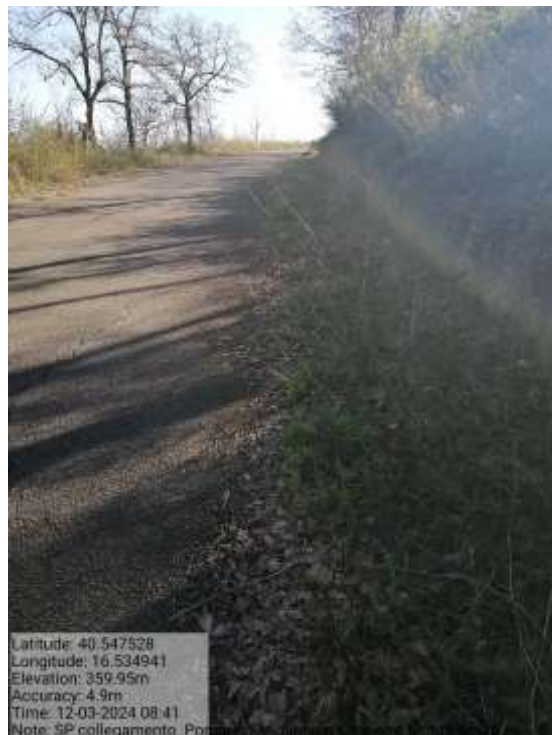
Int.6.3.2.1 S.P. 23 direzione Monte Acuto - Foto29