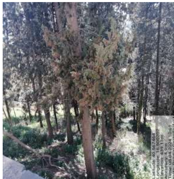
Int. 5.1.3 Pendici Castello fg 22 plle 1053-996- Foto 21 Int. 5.1.3 Pendici Castello fg 22 plle 1053-996 Foto 22