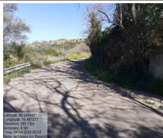
Int.6.3.3.1 S.P.1 Le Baracche 2° Tratto Foto 31