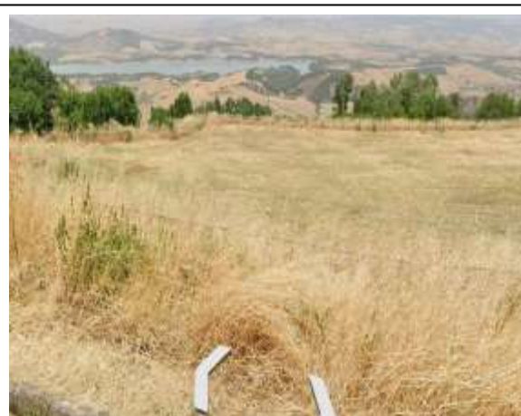
Int. 4.6.2. Realizzazione Staccionata e pulizia del terreno Int. 4.6.2. Realizzazione staccionata S. Antuono