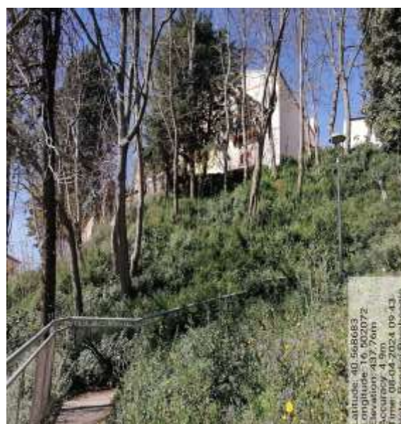
Int. 5.1.1 Monte Acuto fg 35 plla 114 - Foto17