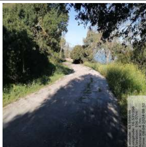
Int. 6.3.1.1 S. Consortile Diga S. Giuliano 2 Tratto area Pic nic - Foto 27