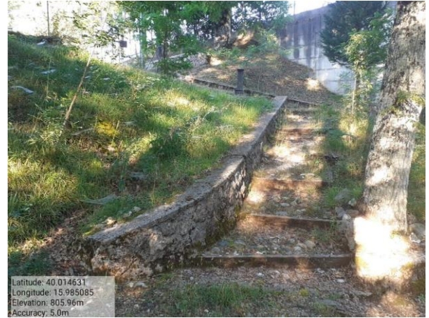
Int. 5.1.1 Bosco Difesa F. 53 P. 129