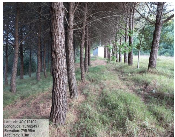
Int. 5.1.3 Bosco Difesa F. 54 P. 178