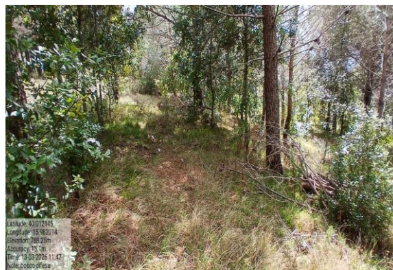
Int. 1.1.1 Viale Tagliafuoco Bosco Difesa Foto 3