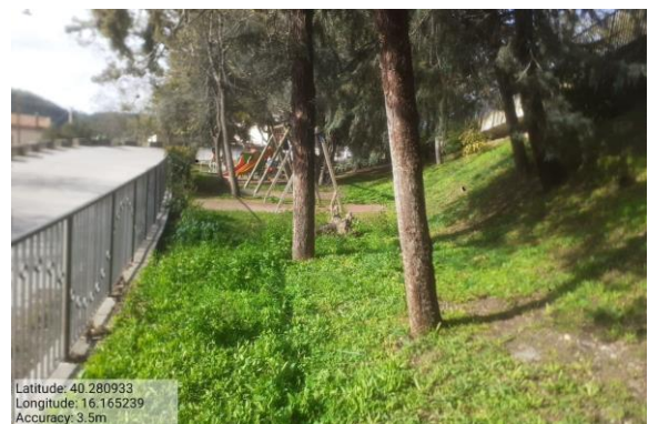
Missione 2.1.1 verde urbano e periurbano