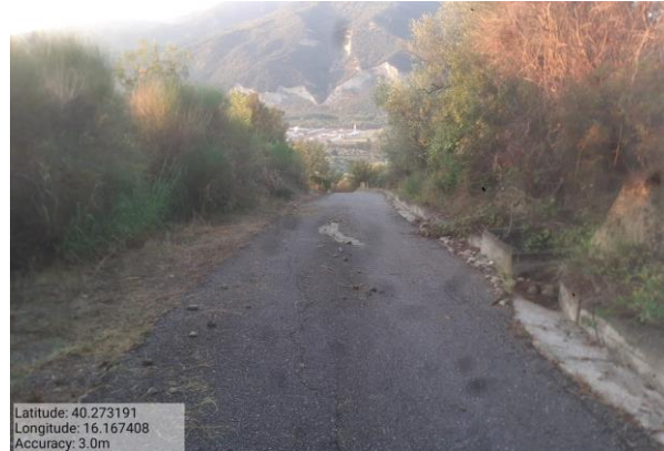
Missione 6.3.6.1-6.3.6.2 coll.SS598-centro storico