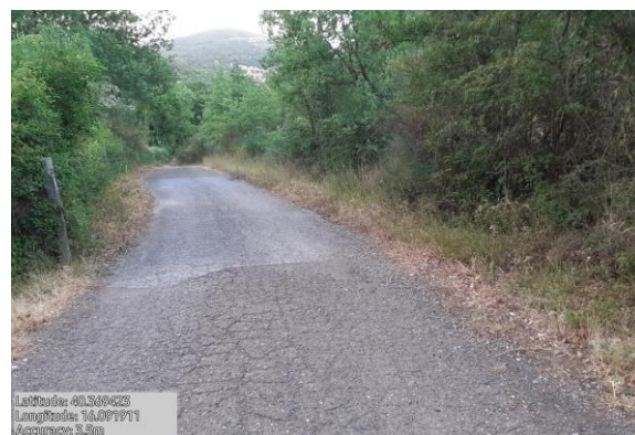
Missione 6.3.12.1-6.3.12.2 sepaline-fontana nuova-renara