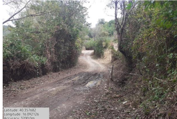
Missione 6.3.6.1-6.3.6.2 viggianese-petto di bilancia