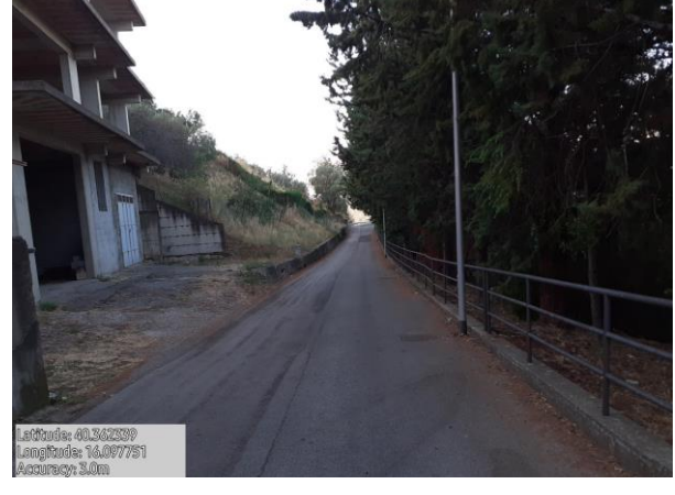
Missione 2.1.1 verde urbano e periurbano