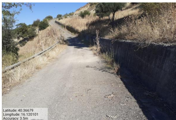
missione 6.3.3.1-6.3.3.2 aria di tutti i venti