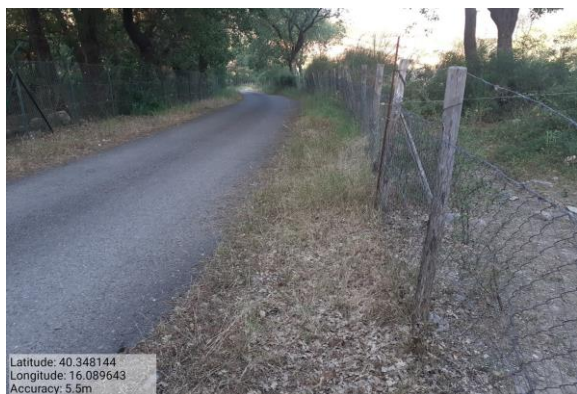
missione 6.3.7.1-6.3.7.2 salice