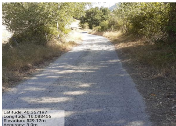
missione 6.3.11.1-6.3.11.2 petto di penne