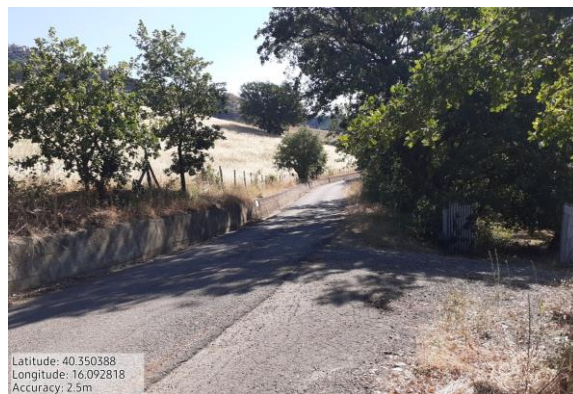
Missione 6.3.8.1-6.3.8.2 piano di bosco-cerzeto-sopra le vigne