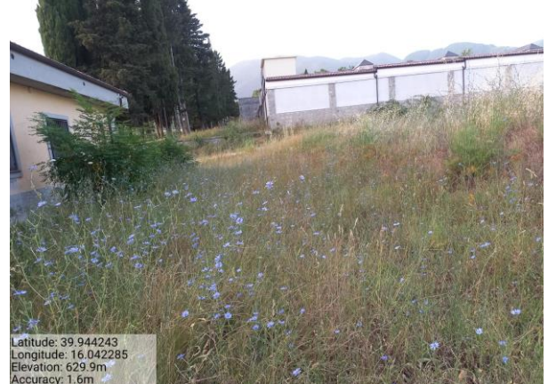
Int. 2.1.1 Area Verde Santa Maria Foto 1