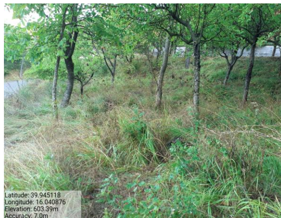
Int. 1.1.1 Viale tagliafuoco Loc. Grinciaso Foto 3