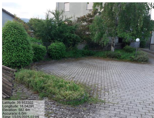
Int. 2.1.1 Area Verde CFS (CTA Rotonda)