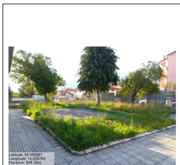
Int. 2.1.1 Area Verde Pietro Nenni Foto 3