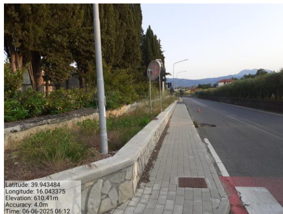
Int. 2.1.1 Area Verde Sede del Parco del Pollino