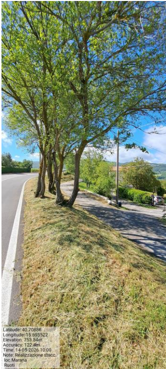
Int.Realizzazione Staccionata.Loc.Marana-Foto 17