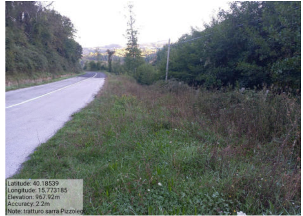
Int. 4.2.1 Foto 9