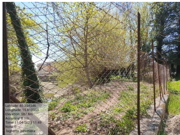
Missione 6.3.1 manutenzione strade e accessori - Foto9