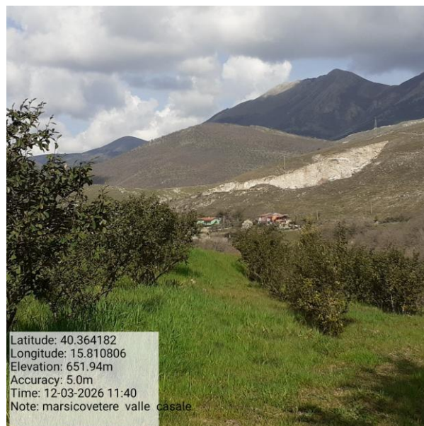
Missione 6.3.6.1 manutenzione strade - Foto5