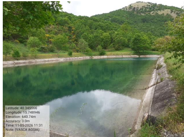
Missione -6.1.7.1 manutenzione vasca Foto5