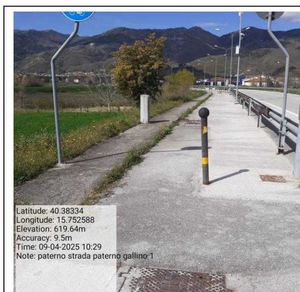
Missione 6.3.1.1 manutenzione strade Foto11 Missione 6.3.1.1 manutenzione strade Foto12