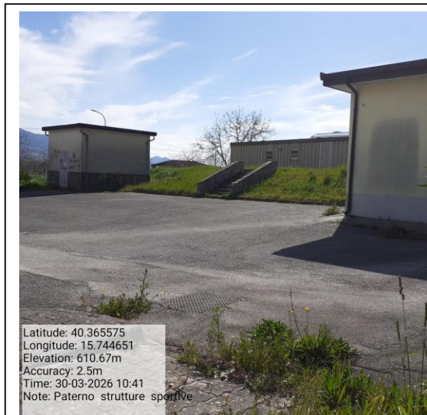
Missione 2.1.1 manutenzione verde urbano - Foto2