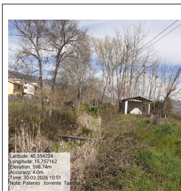
Missione 2.1.1 manutenzione verde urbano - Foto3 - Foto4