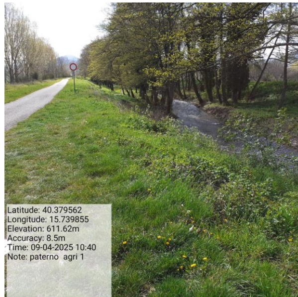
Missione 6.1.6.1 manutenzione reticolo idrografico Foto9 Missione 6.1.6.1 manutenzione reticolo idrografico Foto10