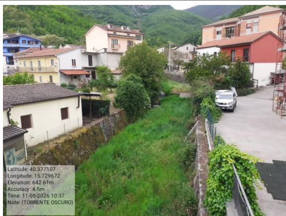
Missione 6.1.2.1 manutenzione vasca Foto 6