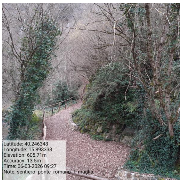
Missione 2.1.1 manutenzione verde urbano Foto2