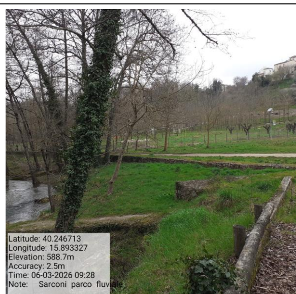
Missione 4.3.3 manutenzione sentiero 2 – Foto 3