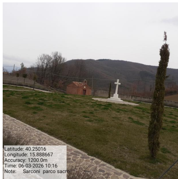
Missione 2.1.1 manutenzione verde urbano Foto1