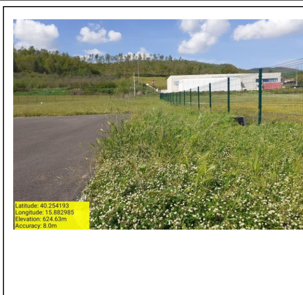
Missione 6.1.1 manutenzione reticolo idrografico - Foto13 Missione 2.1.1 manutenzione verde urbano - Foto14