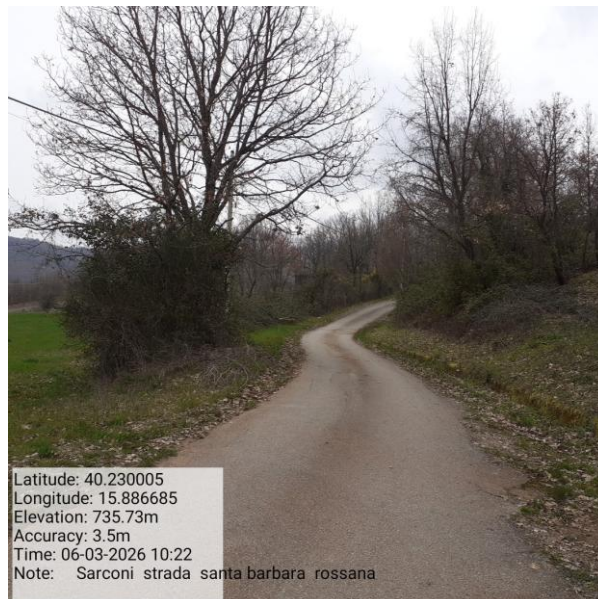
Missione 6.1.5.1 manutenzione impianto Foto 13