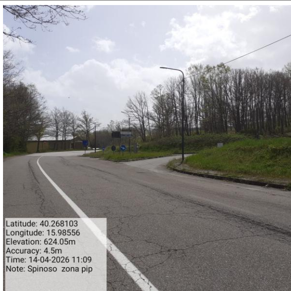
Missione 2.1.1 manutenzione verde urbano - Foto2

Latitude: 40.268103 Longitude: 15.98556 Elevation: 624.05m Accuracy: 4.5m Time: 14-04-2026 11:09 Note: Spinoso zona pip