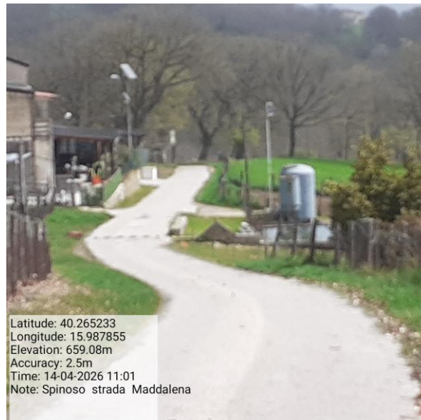
Missione 6.3.3.1 manutenzione strade - Foto5