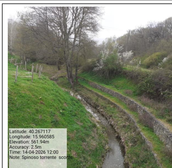
Missione 6.1.1.1 manutenzione reticolo idrografico - Foto11 Missione 6.1.4.1 manutenzione reticolo idrografico - Foto12