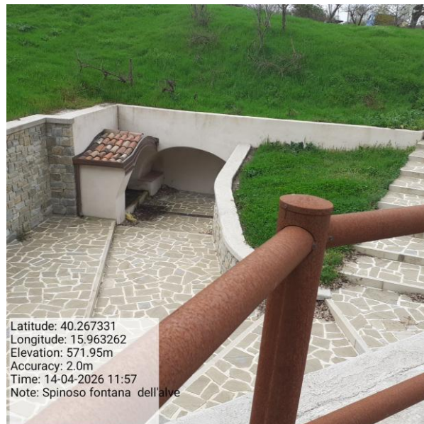
Missione 6.1.5.1 manutenzione canale - Foto9