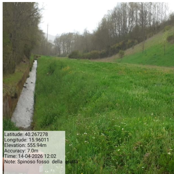
Missione 6.1.3.1 manutenzione reticolo idrografico - Foto13 Missione 6.1.2.1 manutenzione canale Foto14