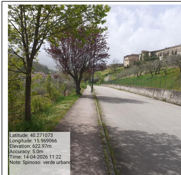
Missione 6.3.4.1 manutenzione strade - Foto6