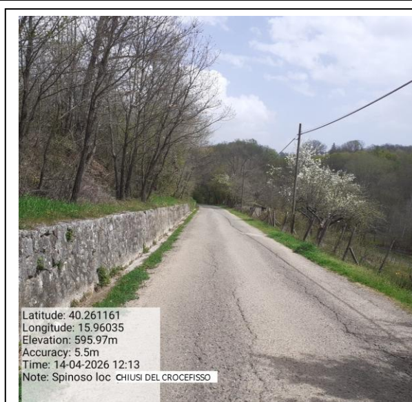
Missione 6.3.6.1 manutenzione strade - Foto15