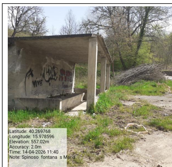
Missione 2.1.1 manutenzione verde urbano - Foto7