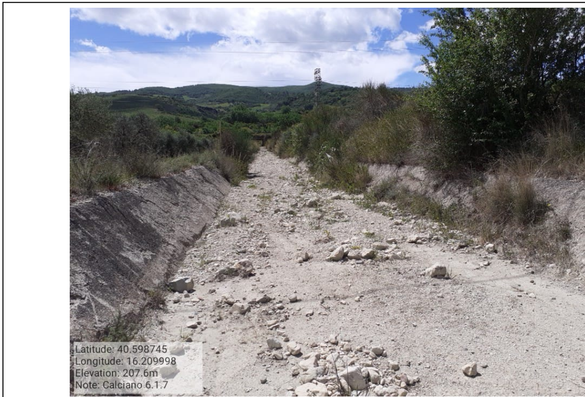
INTERVENTO 6.1.7_Calciano Fg.4 part.592 Canale2 Basento Foto n.23