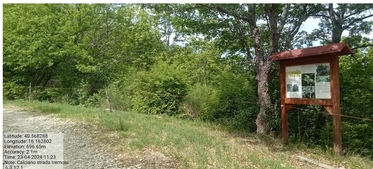
INTERVENTO 6.3.12.1 Calciano F.9 Strada Comunale Fontana del Tremolo