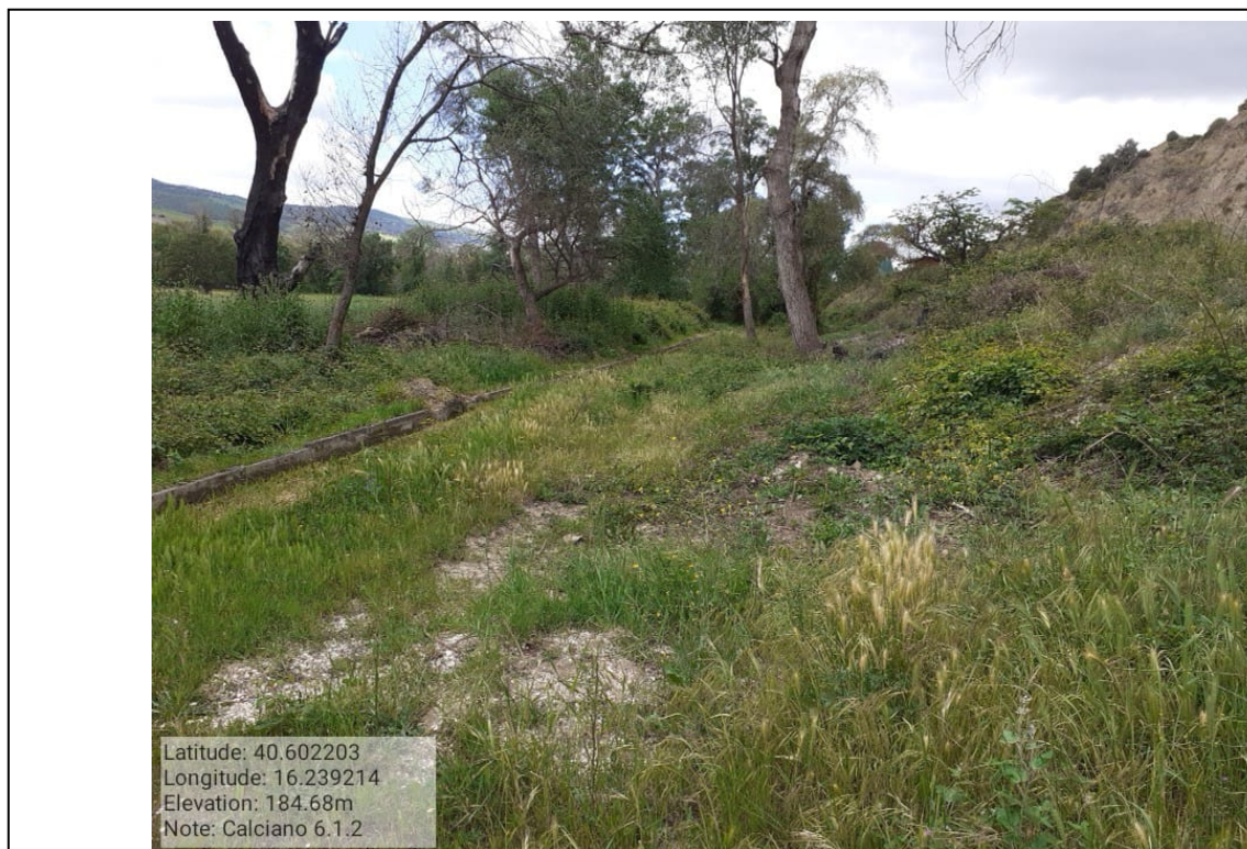
INTERVENTO 6.1.2 Calciano Fg.2 Canaletta irrigazione distretto 3