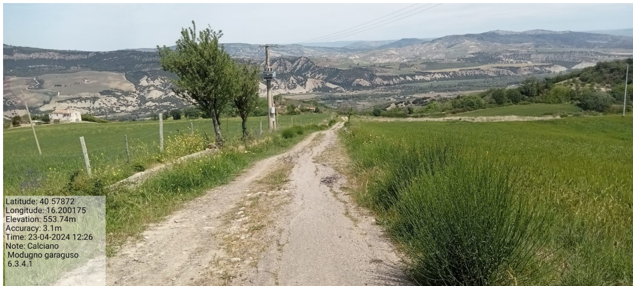
INTERVENTO 6.3.4.1 Calciano strada comunale di collegamento Str. Modugno St.r per Garaguso Foto n. 32