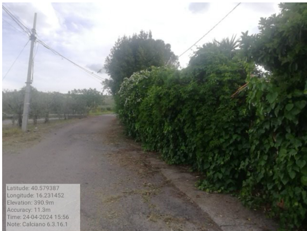
INTERVENTO 6.3.16.1 Calciano Strada Fraz. Parata F.6-13 Foto n.36