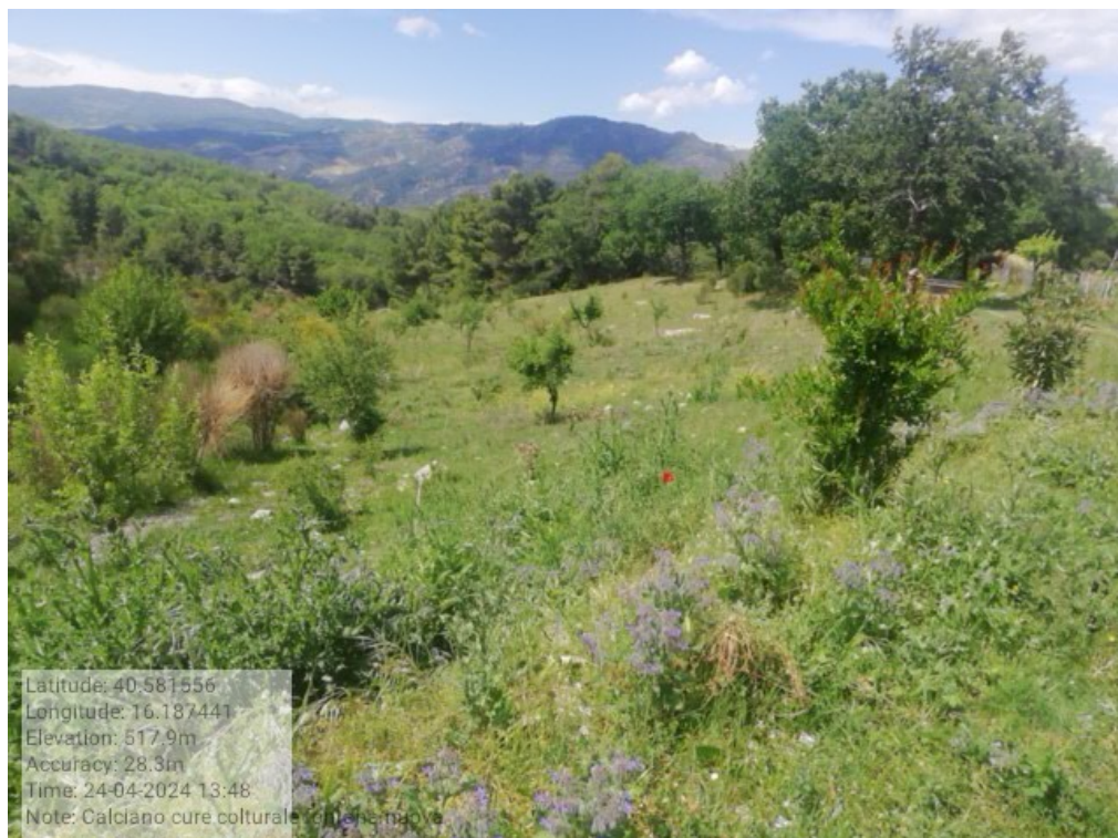
INTERVENTO 5.4.1 Calciano F.9 part.38-37 zona fontana nuova Foto n. 38