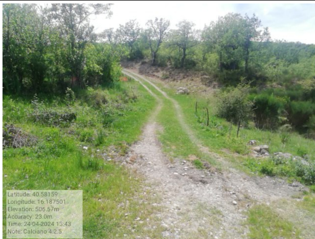
INTERVENTO 4.2.5 Calciano Fg.16 Tratturo Comunale del Bosco Foto n.39