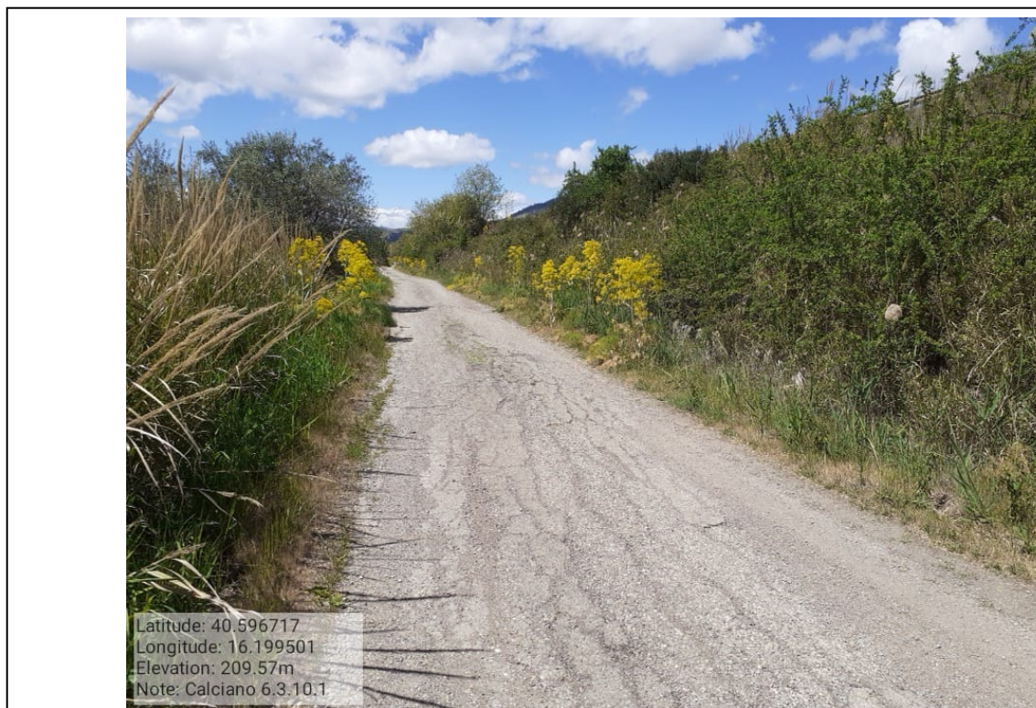
INTERVENTO 6.3.10.1 CALCIANO PANTANO TRATTO 1 Foto n. 15