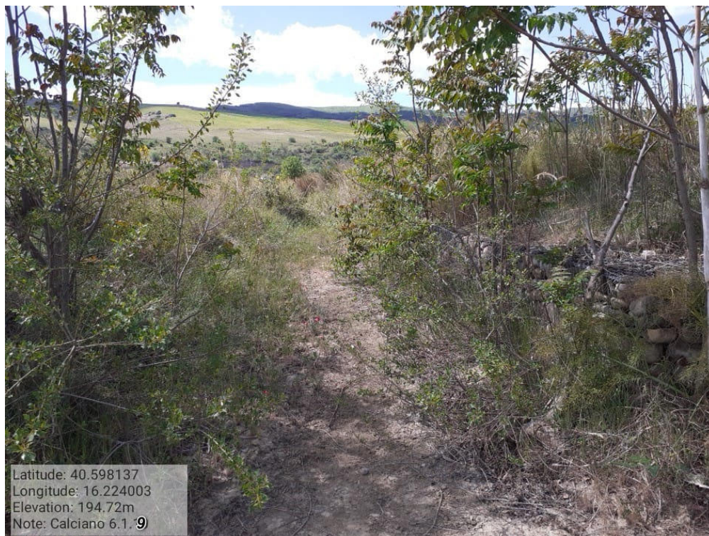
INTERVENTO 6.1.9 Calciano Fg.5 part. Acque Canale A Basento