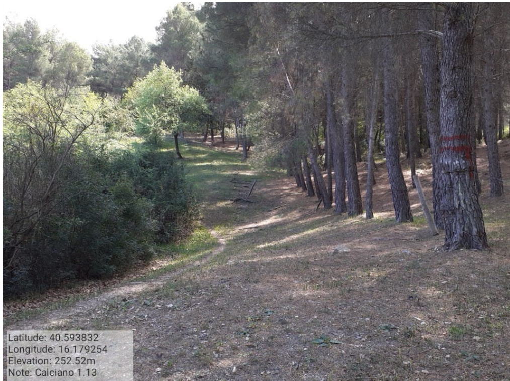
INTERVENTO 1.1.3 CALCIANO Ferrovia - Vignali 3 Foto n. 1