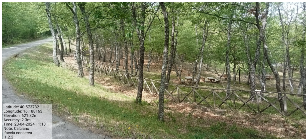
INTERVENTO 1.2.2 CALCIANO CONTRADA CONSERVA FASCIA 2