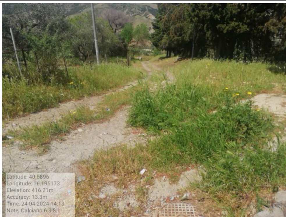
INTERVENTO 6.3.8.1 Calciano f.12 Tratturo Calciano Scalo