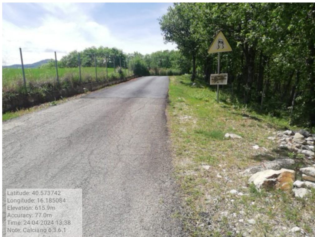
INTERVENTO 6.3.6.1 Calciano Fg.9-22-21-8-15 Strada comunale Calciano Parco Gallipoli Cognato Foto n. 34