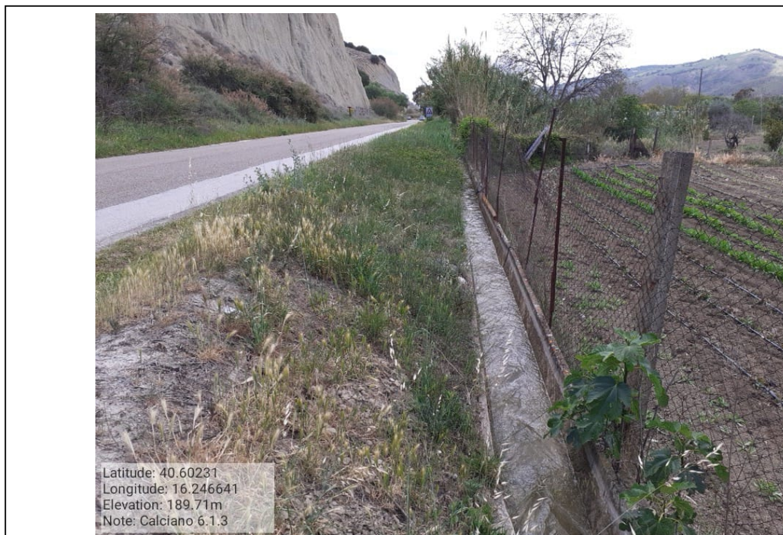
INTERVENTO 6.1.3. Grassano Fg.28-29-26-30-31 Canaletta Irrigazione - Distribuzione Princ.le Ds.3 Foto n.21