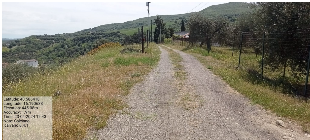
INTERVENTO 6.4.1 Calciano Fg.10 Stada Comunale Calvario Foto n.41