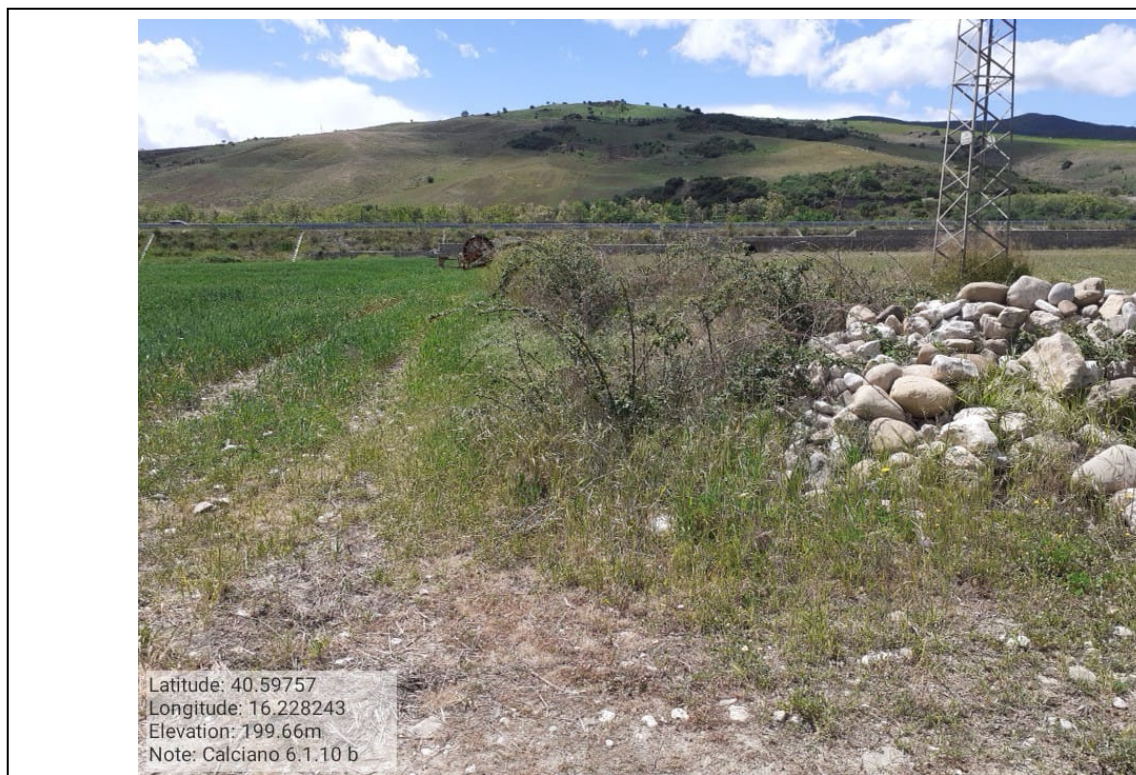
INTERVENTO 6.1.10 Calciano Fg.5 part. Acque Canale B Basento