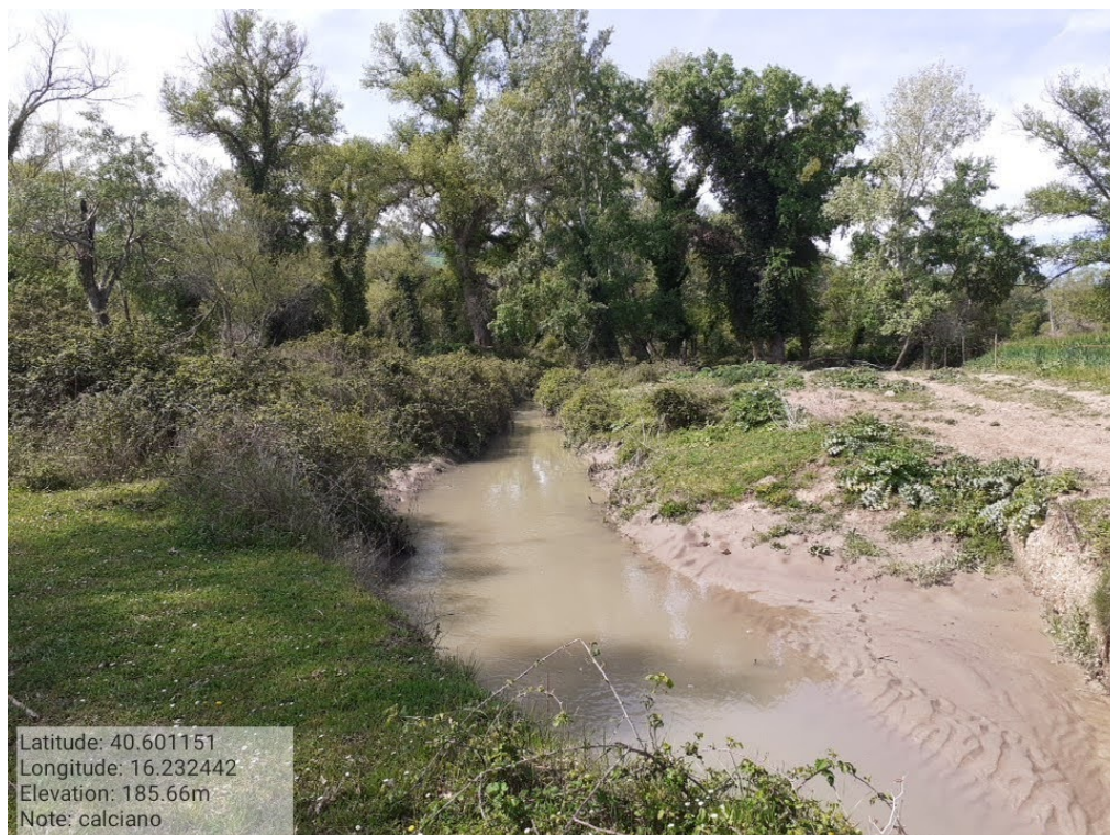
INTERVENTO 6.1.1_ Calciano Fg.2 Impianto di adduzione distretto 3 Foto n.18