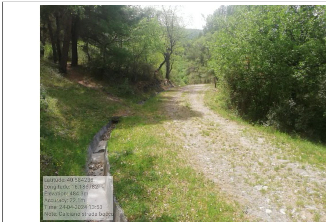
INTERVENTO 6.3.17.1 Calciano F.9 part.37 Strada per il Bosco di Calciano Foto n.37