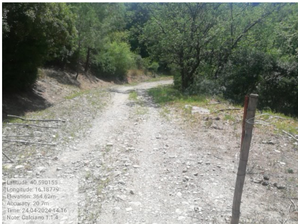
INTERVENTO 6.3.1.1 Calciano Fg.9- Part.33 Loc. Cimitero Foto n. 12 B