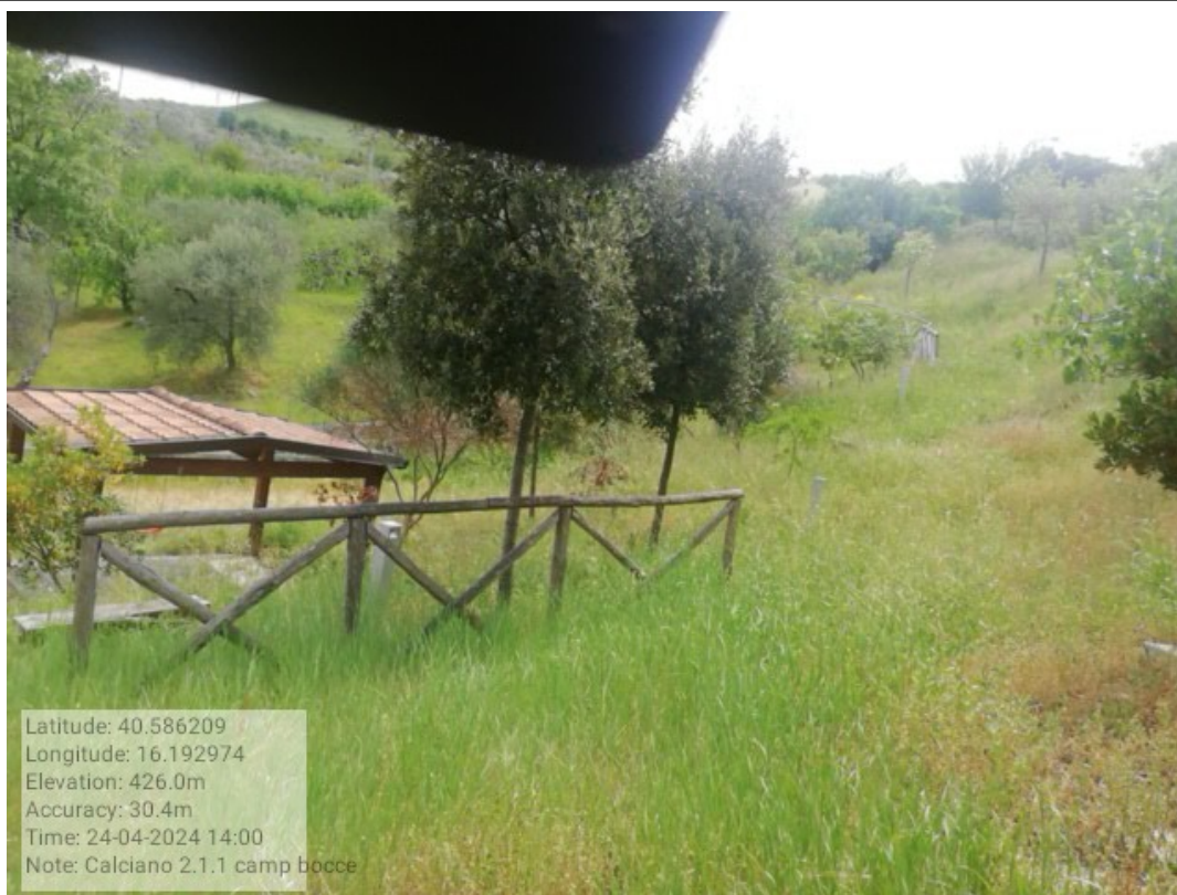
INTERVENTO 2.1.1 CALCIANO VERDE URBANO