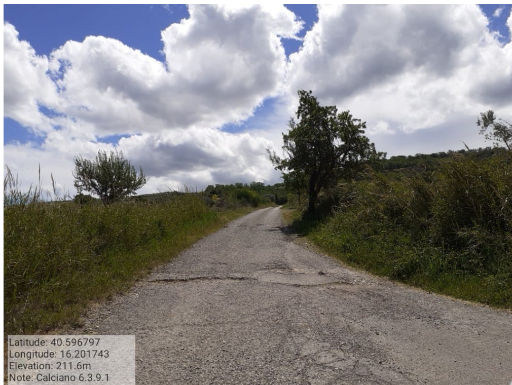
INTERVENTO 6.3.9.1 CALCIANO PANTANO TRATTO 1 Foto n. 14