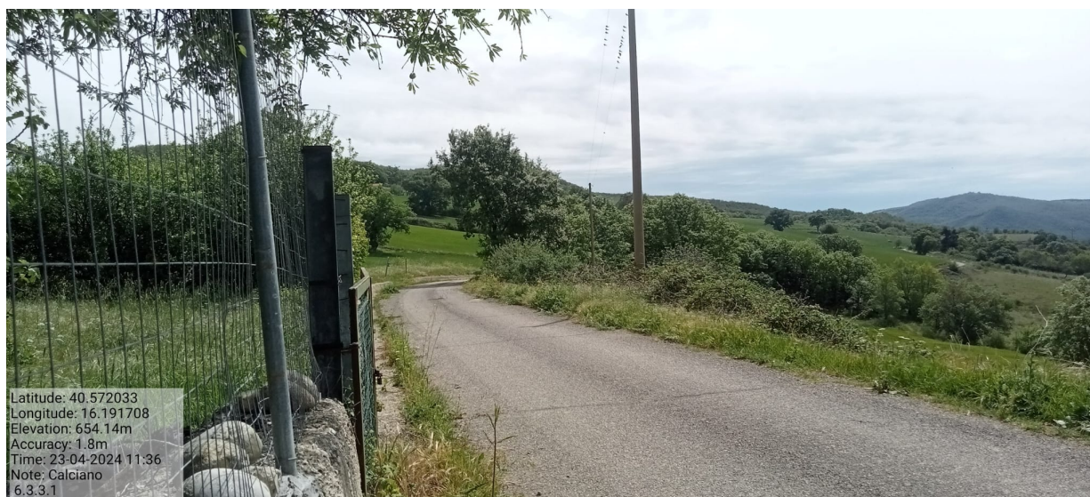
INTERVENTO 6.3.3.1 CALCIANO FG FG. 9 PART 23-24 STRADA BOSCO SERRE Foto n. 12