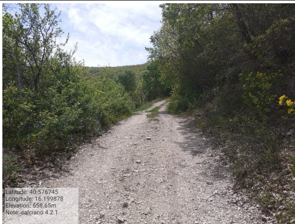
INTERVENTO 4.2.1 Calciano fg.16_Strada Vicinale di Menavento Foto n. 27