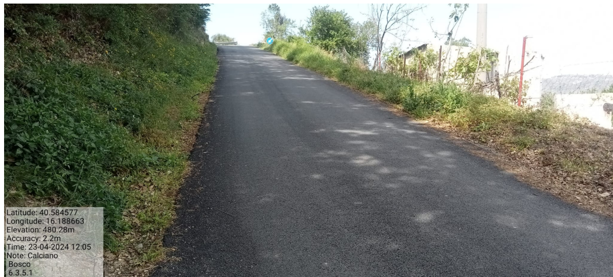
INTERVENTO 6.3.5.1 Calciano Fg.16 Strada Comunale Boschetto