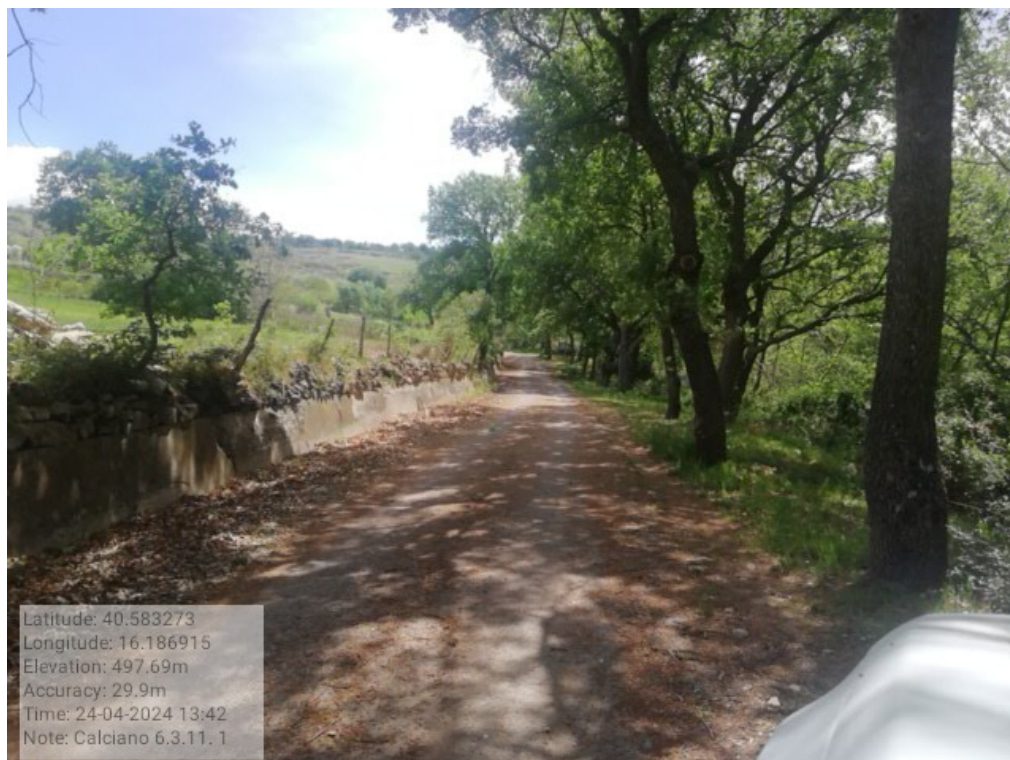
INTERVENTO 6.3.11.1 CALCIANO STRADA FONTANA NUOVA Foto n. 16