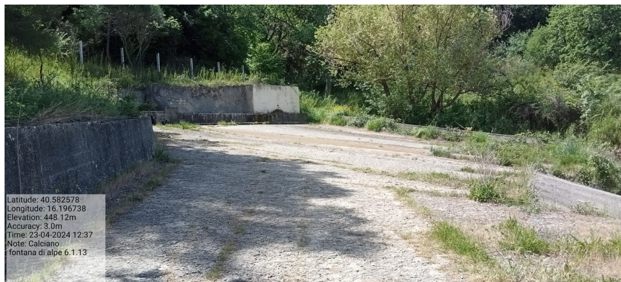
INTERVENTO 6.1.13 Calciano F.17 area fontana Alpe