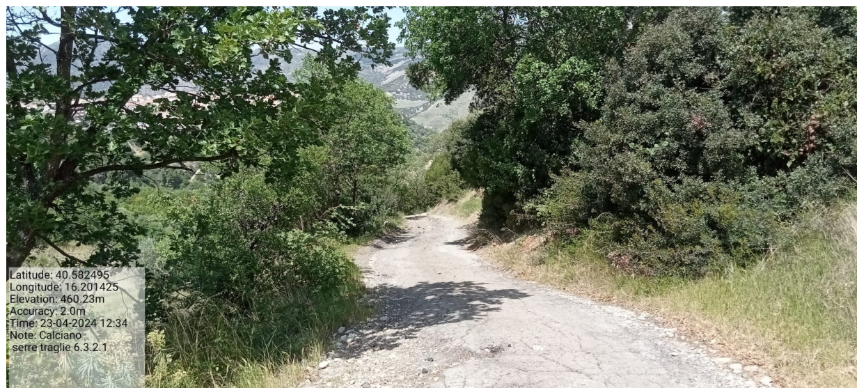
INTERVENTO 1.3.1 Calciano Foglio 9 part.74-66 Contrada Conserva area attrezzata Foto n.30

Latitude: 40.582495 Longitude: 16.201425 Elevation: 460.23m Accuracy: 2.0m Time: 23-04-2024 12:34 Note: Calciano serre traglie 6.3.2.1