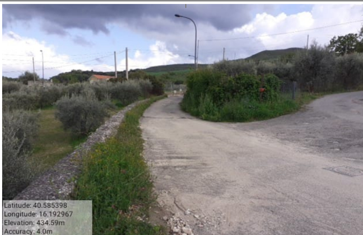
INTERVENTO 2.1.1 CALCIANO VERDE URBANO