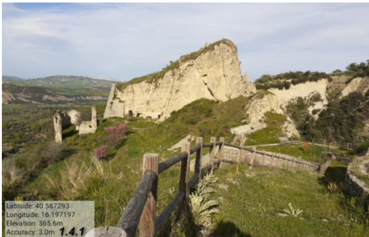
INTERVENTO 1.4.1 FG 11 PART 678 AREA CASTELLO