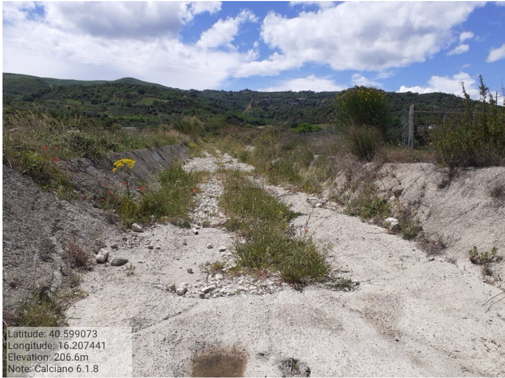
INTERVENTO 6.1.8_Calciano Fg.4 part.ACQUE Canale3 Basento Foto n. 22