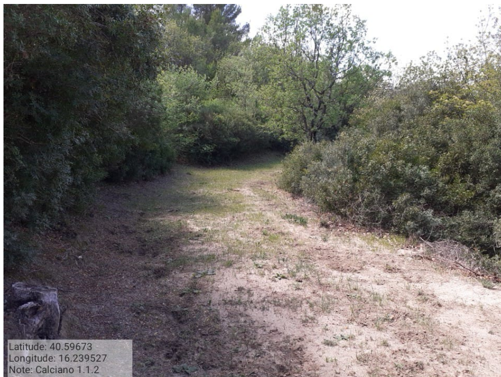
INTERVENTO 1.1.2 CALCIANO FG.9 PART.35 Vignali Ferrovia -2