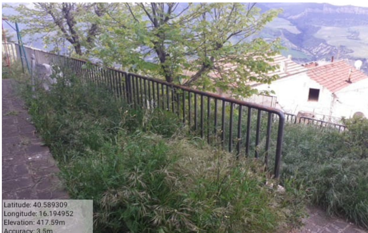
INTERVENTO 2.1.1 CALCIANO VERDE URBANO