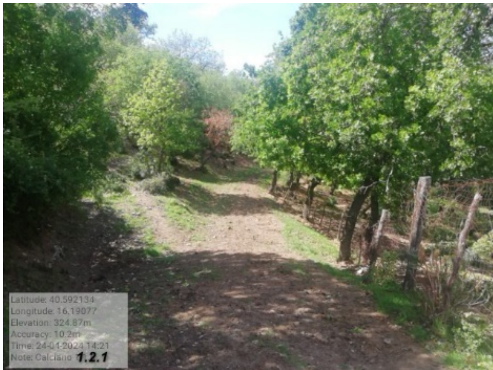
INTERVENTO 1.2.1. CALCIANO- FG.9 PART. 17 - LOC . Ariccione Foto n. 2