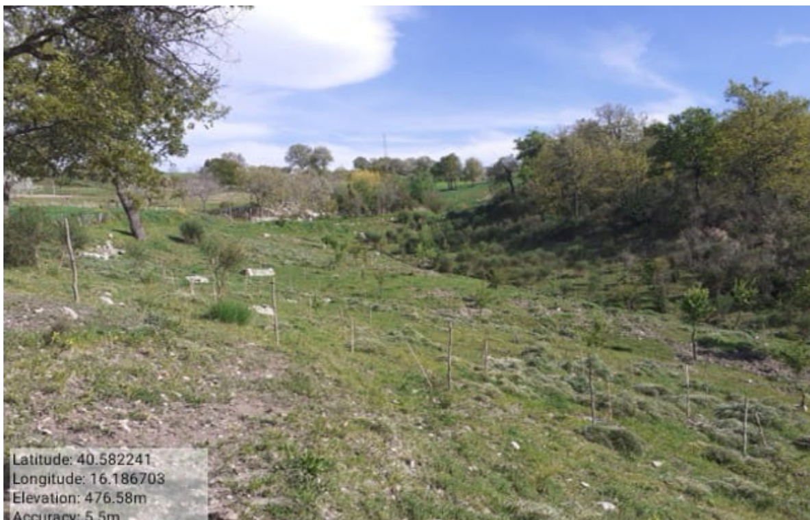
INTERVENTO 3.2.1.2 CALCIANO FG 9 P ART.37-34-33 ZONA VIGNALI AERTURA BUCHE Foto n.11