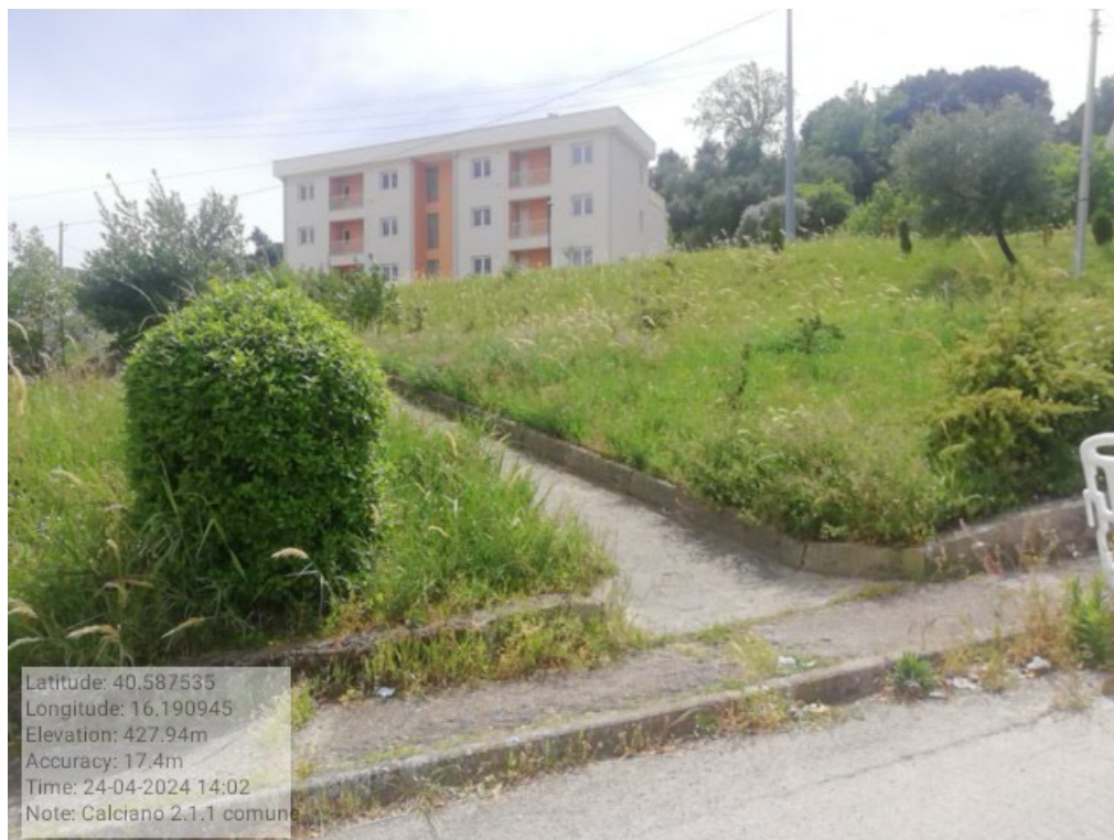
INTERVENTO 2.1.1 CALCIANO VERDE URBANO