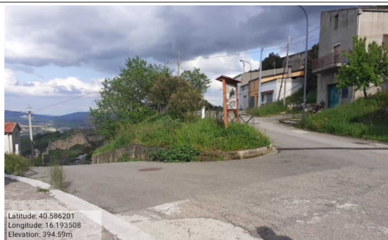
INTERVENTO 2.1.1 CALCIANO VERDE URBANO