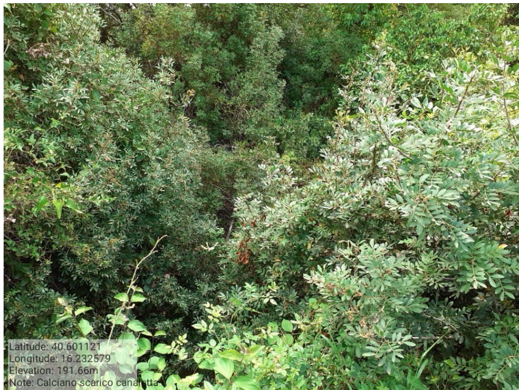
INTERVENTO 6.1.4 Calciano Fg.2 impianto irrigazione distretto 3 - canale di scarico - Foto n.20