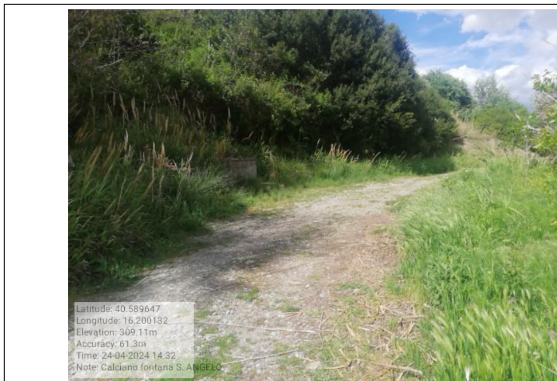
INTERVENTO 6.1.11 CALCIANO FONTANA SANT'ANGELO Foto n. 13