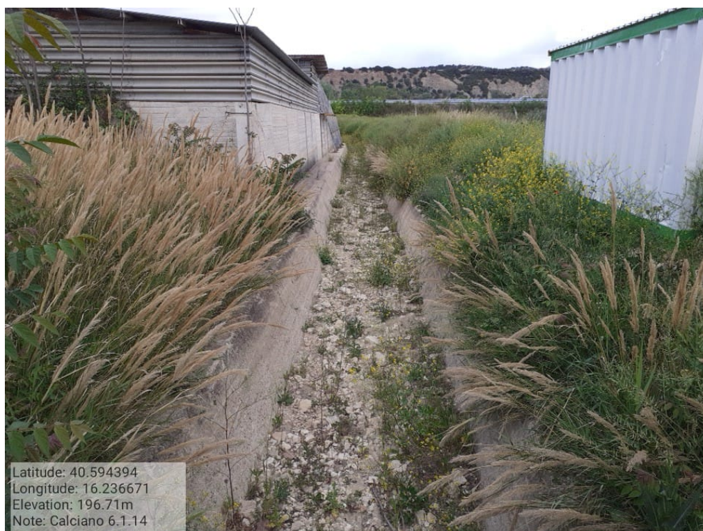
INTERVENTO 6.1.14. Calciano F.2 Acque Foto n.24