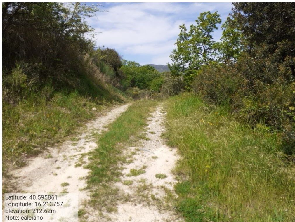
INTERVENTO 4.2.4 Calciano f.4 part.619-333-630 Foto n. 28